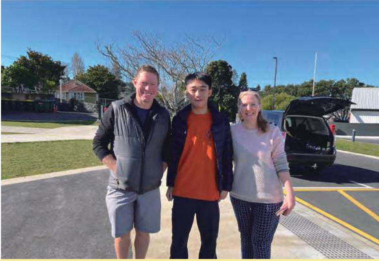
通過政府合法立案、家庭背景調查