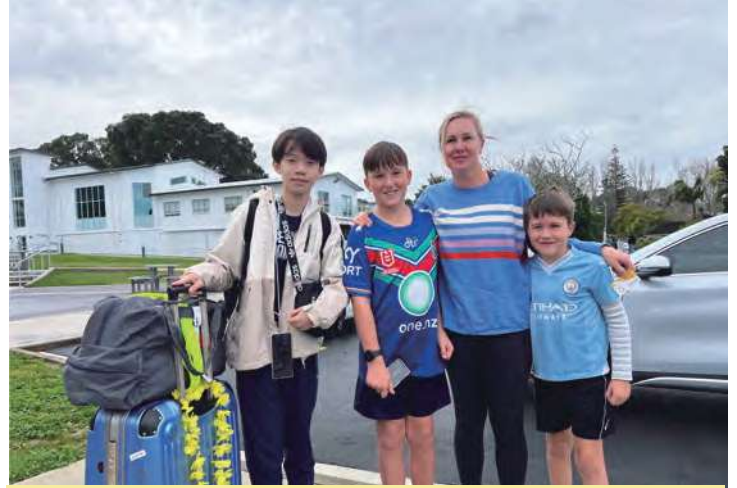
學校負責監督管理並有專人定期訪視與關懷